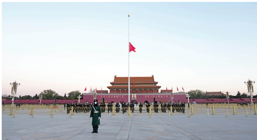
12月1日,北京天安门下半旗志哀,悼念江泽民同志逝世。

之日起到江泽民同志追悼大会举行之日止,北京天安门、新华门、人民大会堂、外交部和香港中联办、澳门中联办、我驻外使领馆下半旗志哀。