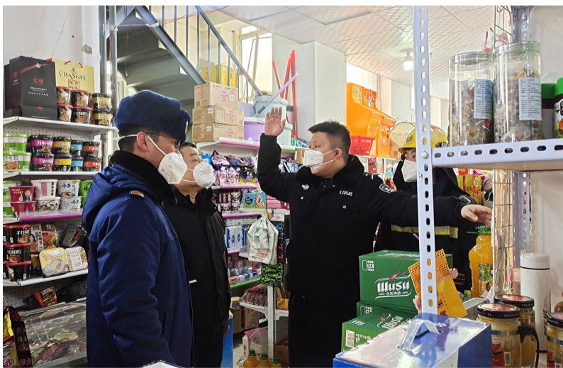
12月15日,昌吉市消防救援大队在蓝爵尚筑小区沿街商铺开展消防安全检查。