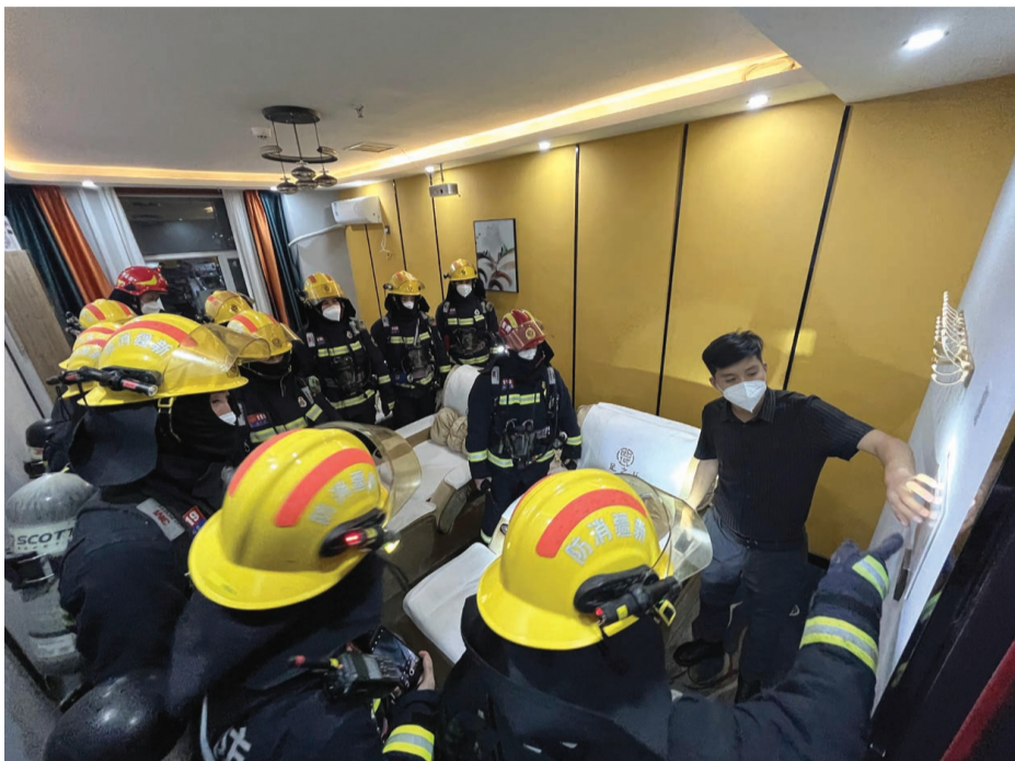
12月24日,昌吉州消防救援支队消防员在昌吉市一家足浴馆开展夜查。

此次消防安全夜查行动进一步提高了各大场所相关人员的消防安全意识和火灾防范能力,有效消除了消防安全隐患,营造了良好的消防安全环境。