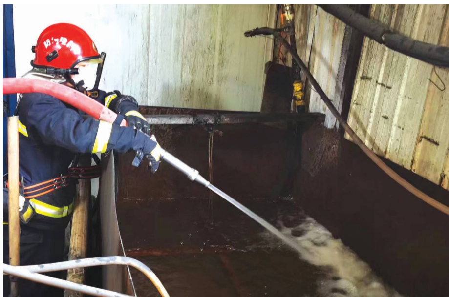
12月25日,奇台县吐虎玛克中街消防救援站消防员在给东湾镇供热站设备注水。

本报讯 记者付小芳、通讯员刘臣报道:12月25日16时许,奇台县东湾镇供热站向消防部门求助,因供热管道损坏,供热管网水压不足,导致供水线路压力小,向管道注水缓慢,如不及时注水将影响辖区400余户居民的正常供暖。奇台县吐虎玛克中街消防救援站接到求助后,迅速出动消防员为该供热站先后送水32吨,解决供热站水压不足的问题。