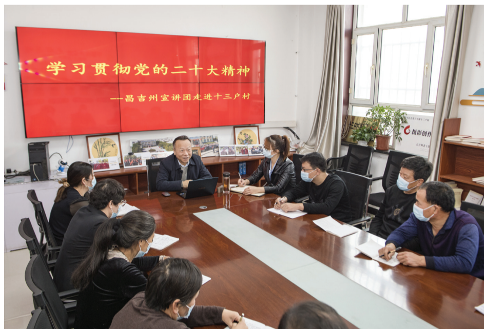
12月10日,昌吉市六工镇十三户村村委会,昌吉州庭州宣讲团讲师在给村民宣讲党的二十大精神。

截至目前,我州各地各级党组织组建295个宣讲团,宣讲团成员共计1576人,累计开展党的二十大精神“线上+线下”宣讲5847场次,覆盖群众64.15万人次。