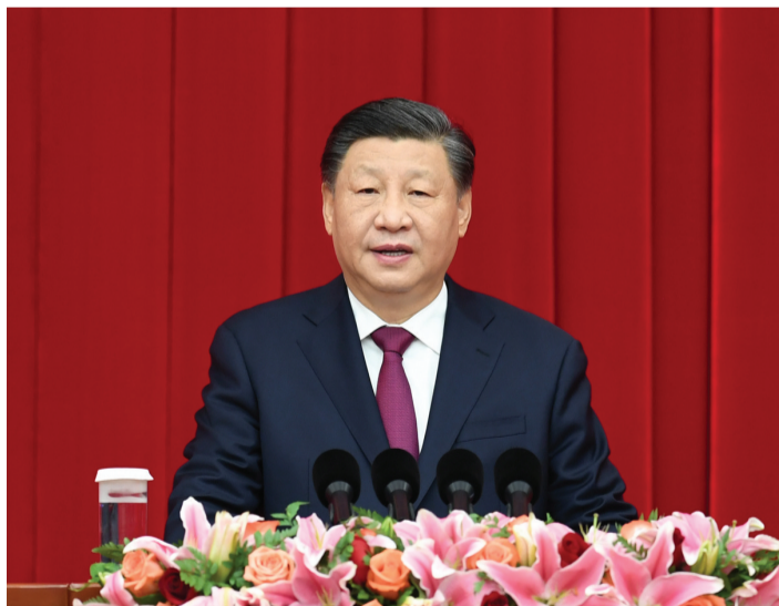
12月30日,全国政协在北京举行新年茶话会。中共中央总书记、国家主席、中央军委主席习近平在茶话会上发表重要讲话。