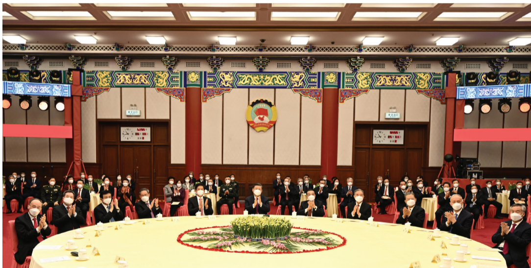
12月30日,全国政协在北京举行新年茶话会。党和国家领导人习近平、李克强、栗战书、汪洋、李强、赵乐际、王沪宁、蔡奇、丁薛祥、李希、王岐山出席茶话会并观看演出。

新华社北京12月30日电 中国人民政治协商会议全国委员会12月30日上午在全国政协礼堂举行新年茶话会。党和国家领导人习近平、李克强、栗战书、汪洋、李强、赵乐际、王沪宁、蔡奇、丁薛祥、李希、王岐山等同各民主党派中央、全国工商联负责人和无党派人士代表、中央和国家机关有关方面负责人以及首都各族各界人士代表欢聚一堂,共迎2023年元旦。