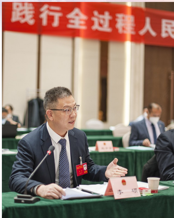
1月6日,在昌吉回族自治州第十六届人民代表大会第二次会议上,昌吉代表团代表审议政府工作报告。