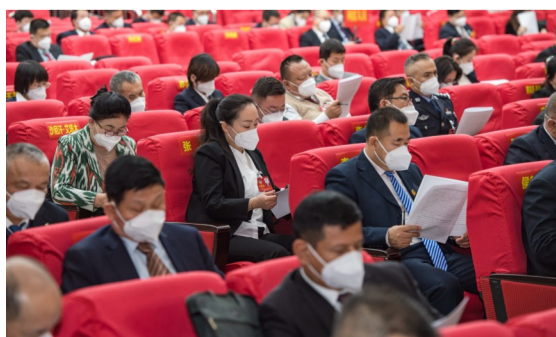
1月5日,委员们认真听取政协昌吉州第十三届委员会常务委员会工作报告和昌吉州政协十三届一次会议以来提案工作情况报告。