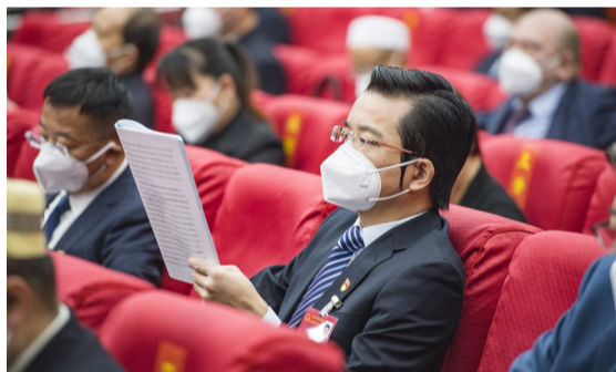
1月6日上午,昌吉回族自治州第十六届人民代表大会第二次会议开幕。代表们认真听取政府工作报告。