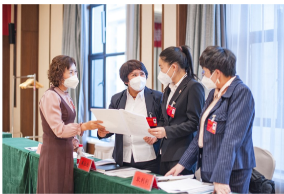
1月6日,在昌吉回族自治州第十六届人民代表大会第二次会议上,玛纳斯代表团代表在交流意见建议。