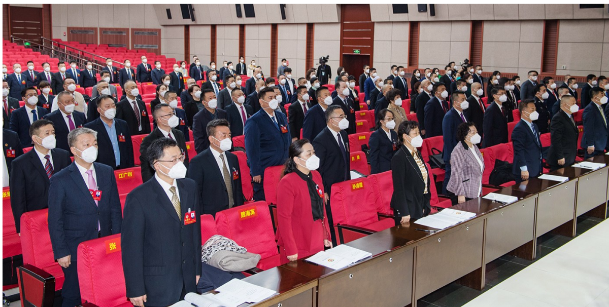
1月5日上午,中国人民政治协商会议昌吉回族自治州第十三届委员会第二次会议在昌吉隆重开幕,委员们起立齐唱国歌。