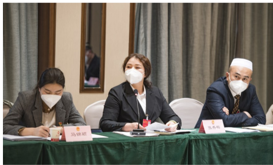
1月6日,在昌吉回族自治州第十六届人民代表大会第二次会议上,呼图壁代表团代表审议政府工作报告。