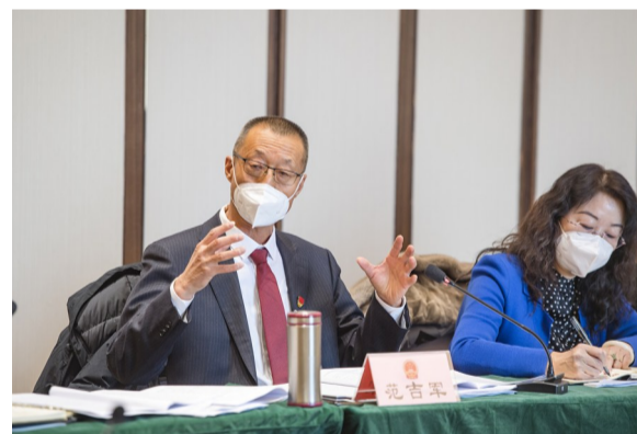
1月6日,在昌吉回族自治州第十六届人民代表大会第二次会议上,奇台代表团代表审议政府工作报告。