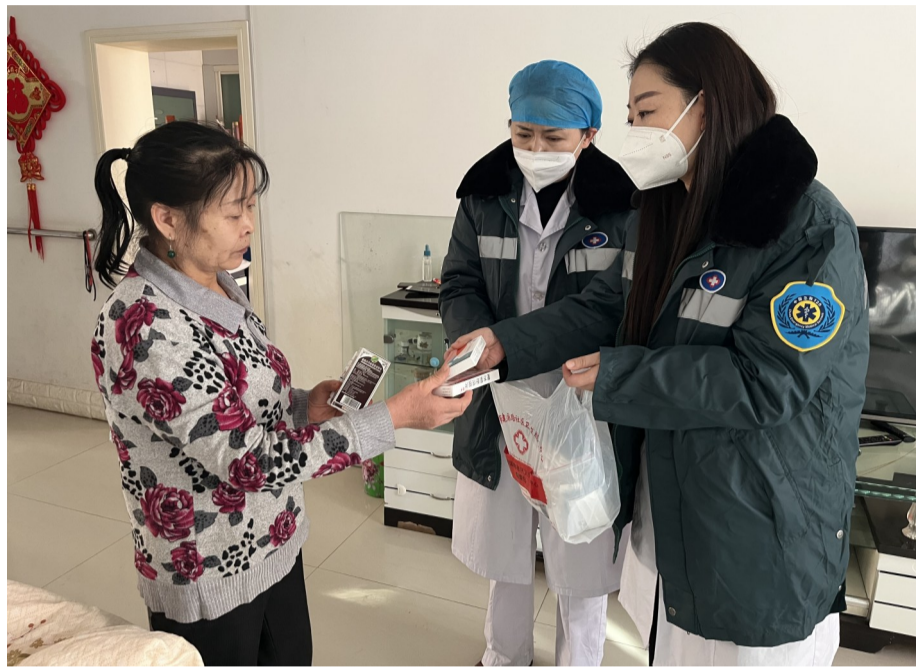
1月6日,昌吉市建国路社区卫生服务中心医护人员上门为辖区居民进行健康检查,发放爱心“健康包”。

据介绍,目前,建国路社区卫生服务中心主要围绕65岁以上老年人,进行第一批次“健康包”发放。记者在现场看到,该中心的