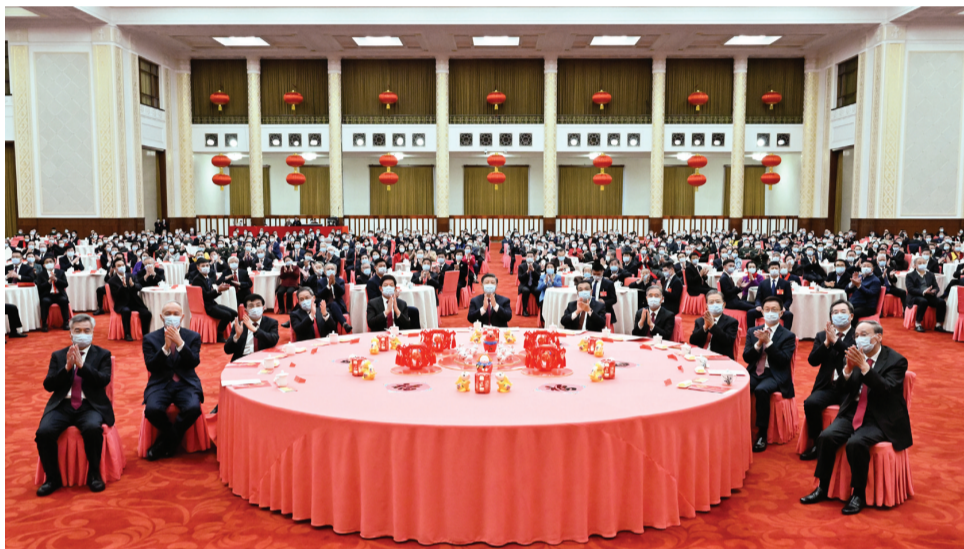
1月20日,中共中央、国务院在北京人民大会堂举行2023年春节团拜会。中共中央总书记、国家主席、中央军委主席习近平发表讲话。