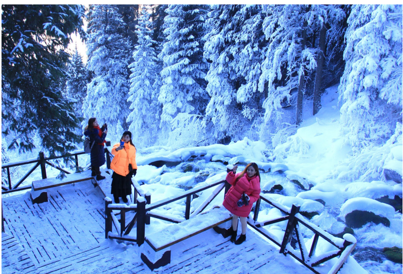
游客在天山天池潜龙渊步道拍照留影。