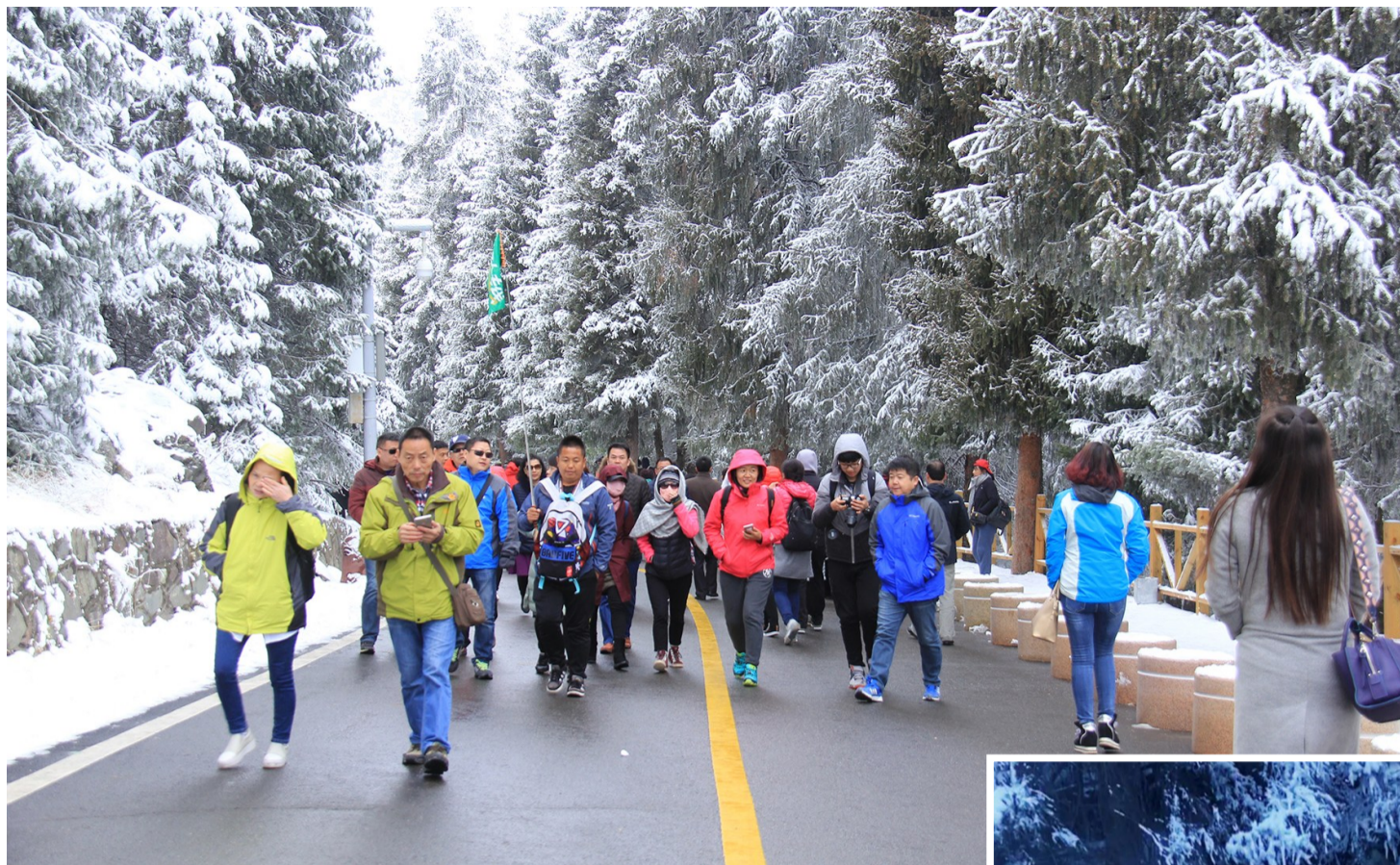
游客在天山天池赏雪。