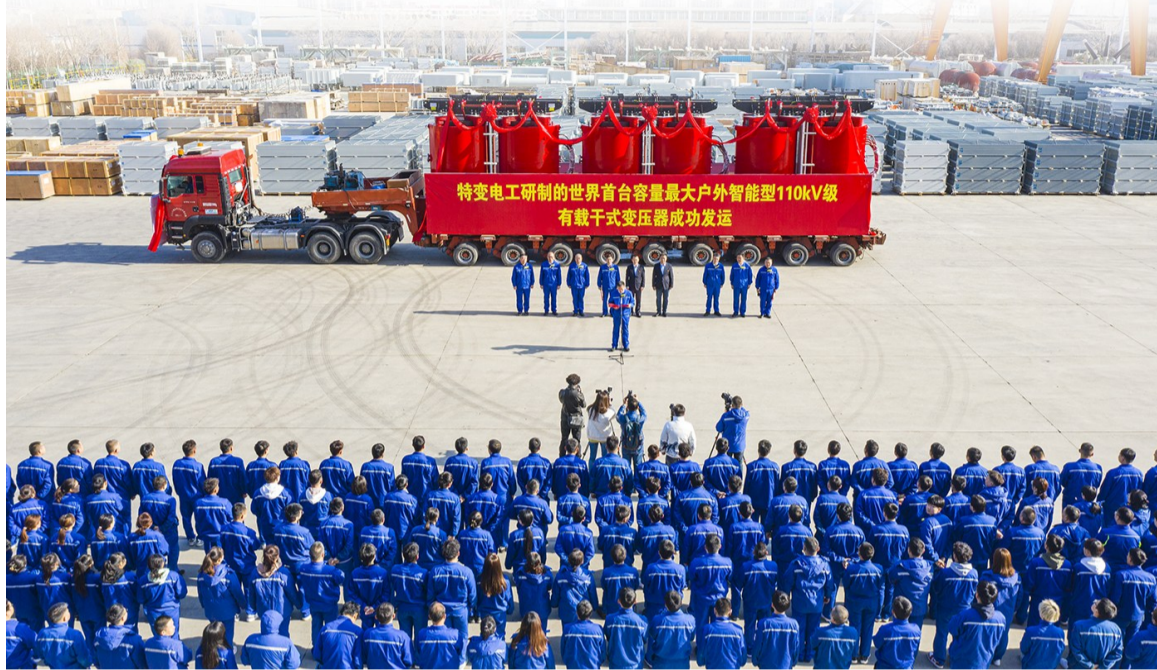
3月21日,由特变电工自主研发的世界首台大容量智能型有载干式变压器发运仪式现场。