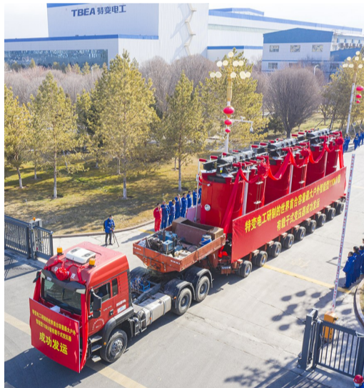
3月21日,由特变电工自主研发的世界首台大容量智能型有载干式变压器,从特变电工新疆输变电科技产业园成功发运。

3月21日,由特变电工自主研发的世界首台大容量智能型有载干式变压器,从特变电工新疆输变电科技产业园成功发运。经过国家变压器质量监督检验中心现场认证,这台产品容量达到5万千伏安,运行额定电压为115千伏,各项试验数据优于相关标准和技术要求,标志着该产品容量和电压等级代表了行业最高水平,填补多项世界空白,实现了里程碑式的突破。