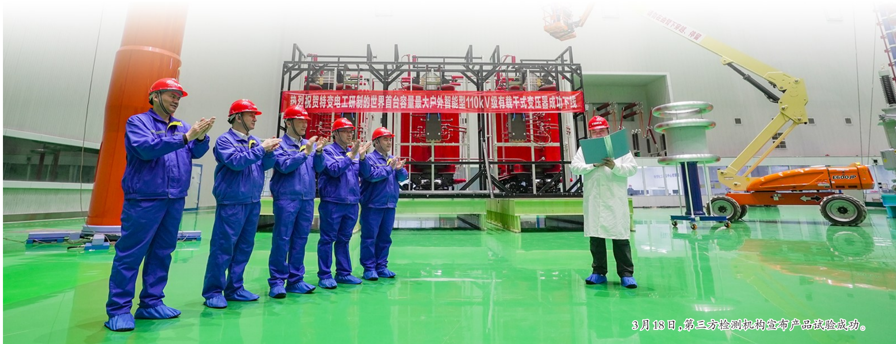
3月18日,第三方检测机构宣布产品试验成功。

3月12日,特变电工新疆输变电科技产业园特高压生产车间,特变电工新疆变压器厂员工正在组装SCZ-H-ZN-50000千伏安115千伏36.5千伏干式变压器。特变电工新疆变压器厂研制的SCZ-H-ZN-50000千伏安115千伏36.5千伏干式变压器是目前世界上容量最大、电压等级最高的户外智能型有载干式电力变压器。产品具有环保、安全可靠、免维护等特性。