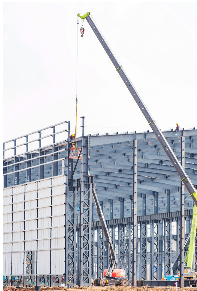
3月22日,昌吉高新区新疆成飞新材料有限公司风电叶片生产基地项目在加紧施工。据了解,昌吉高新区2023年拟实施项目59个,总投资115.8亿元。一季度,投资规模500万以上项目复工开工32个,计划完成投资2.08亿元,同比增长102.65%。