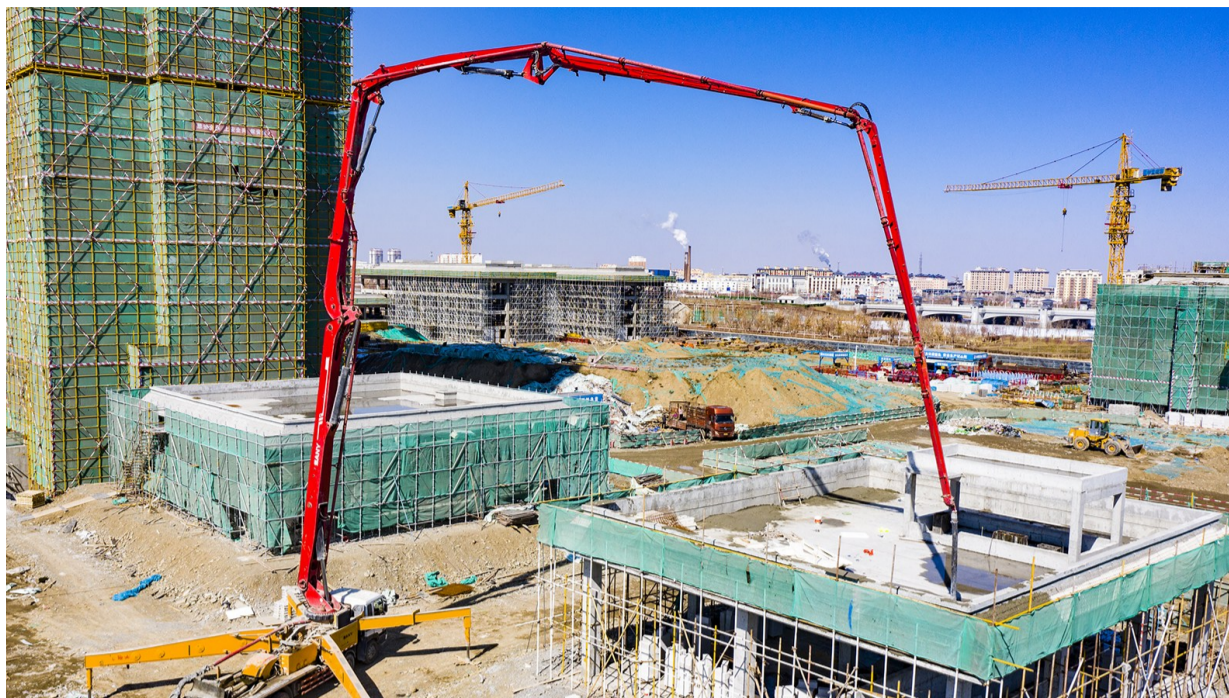
3月24日,吉木萨尔县人民医院新院区、感染中心暨医疗救治能力提升建设项目现场,施工人员进行基建作业。该项目总投资7.9亿元,总建筑面积14.3万平方米,致力于新型智慧医院的综合建设。