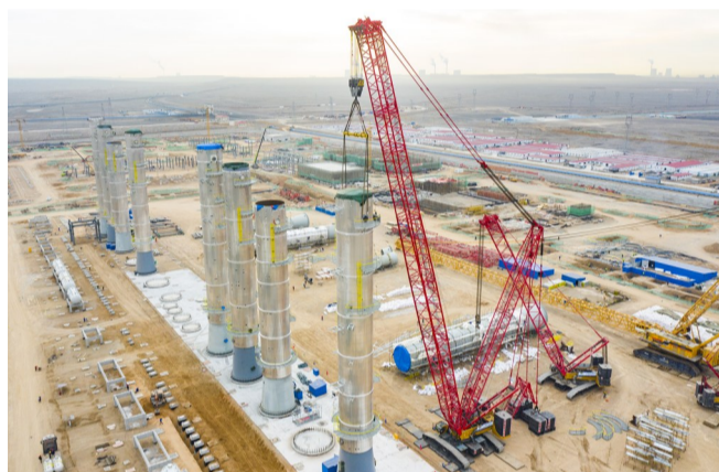
3月17日上午,准东经济技术开发区新疆某公司年产20万吨高纯晶硅项目一期年产10万吨多晶硅及配套设施项目加紧建设中。