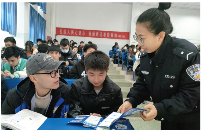
4月4日,昌吉学院派出所民警给学生发放防范电信网络诈骗宣传单。

本报讯 记者廖冬云报道:为进一步强化学校师生的国家安全法治意识,营造维护国家安全的浓厚法治氛围,增强防范和抵御安全风险能力,4月4日,昌吉市公安局昌吉学院派出所民警联合中国邮政储蓄银行昌吉市支行的工作人员走进昌吉学院,共同开展国家安全教育普法宣传活动。