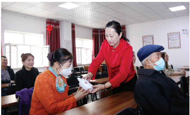
4月6日,天山花园社区干部给参加安全知识有奖竞答的居民发放小礼品。

本报讯 记者付小芳报道:今年4月15日是第八个全民国家安全教育日,为加强国家安全法律法规宣传普及,提高辖区群众国家安全法治意识,增强防范和抵御安全风险能力,4月6日,昌吉市延安北路街道天山花园社区组织警务室民警、社区干部和居民共同开展了国家安全教育日主题宣传活动。