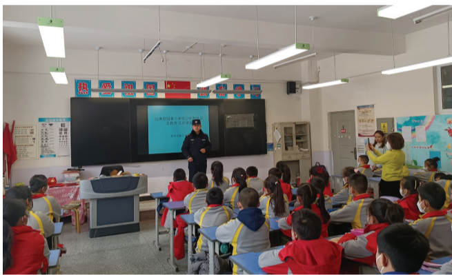
4月10日,延安北路派出所民警来到昌吉市第三小学开展全民国家安全教育日活动。

本报讯 记者廖冬云、通讯员马媛报道:在第八个全民国家安全教育日来临之际,4月10日,昌吉市公安局延安北路派出所组织民警深入昌吉州实验小学、昌吉市第二小学、昌吉市第三小学、昌吉市一中开展“宣传普法进校园 安全教育护成长”系列活动。