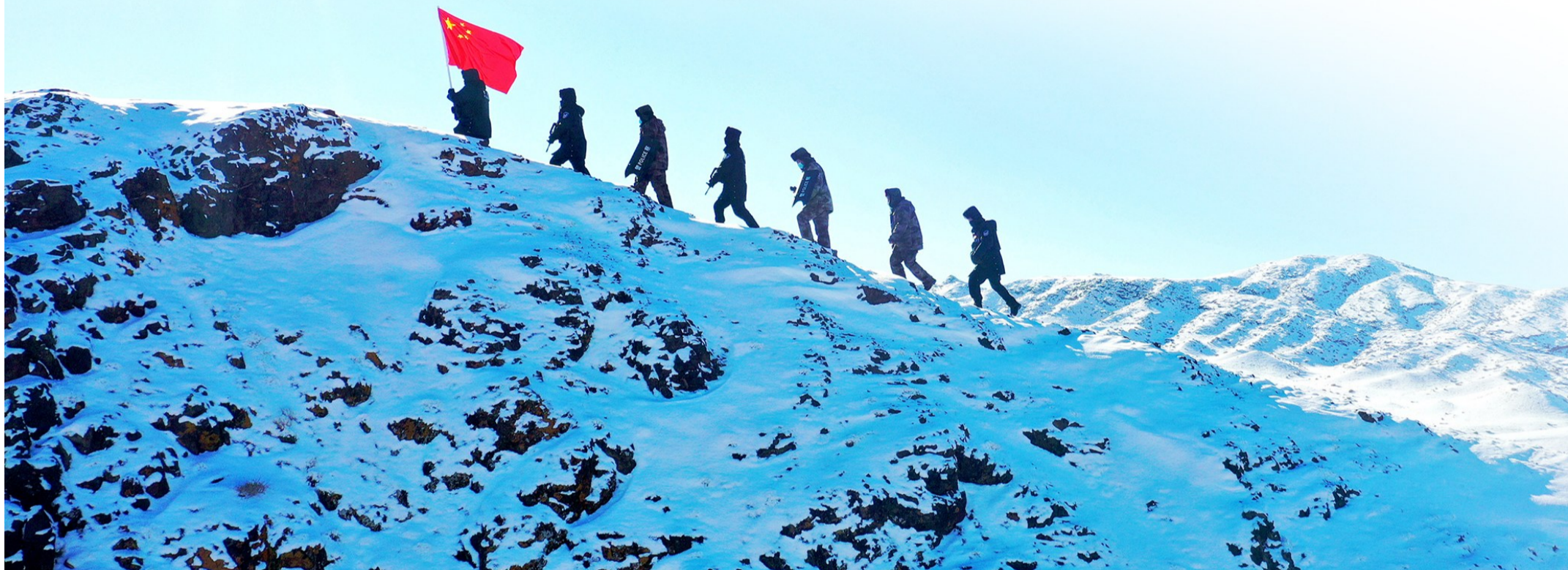
大黄水泉边境派出所民警联合护边员在海拔3200米的边境一线开展边境踏查。

终年大风,极度干旱,荒凉孤寂……方圆百里无人区,这里更像是一座无人的“孤岛”。这里就是昌吉边境管理支队大黄水泉边境派出所,成立于1964年,担负着近50公里边境线的巡逻防控和3400平方公里边境辖区的治安管控任务。