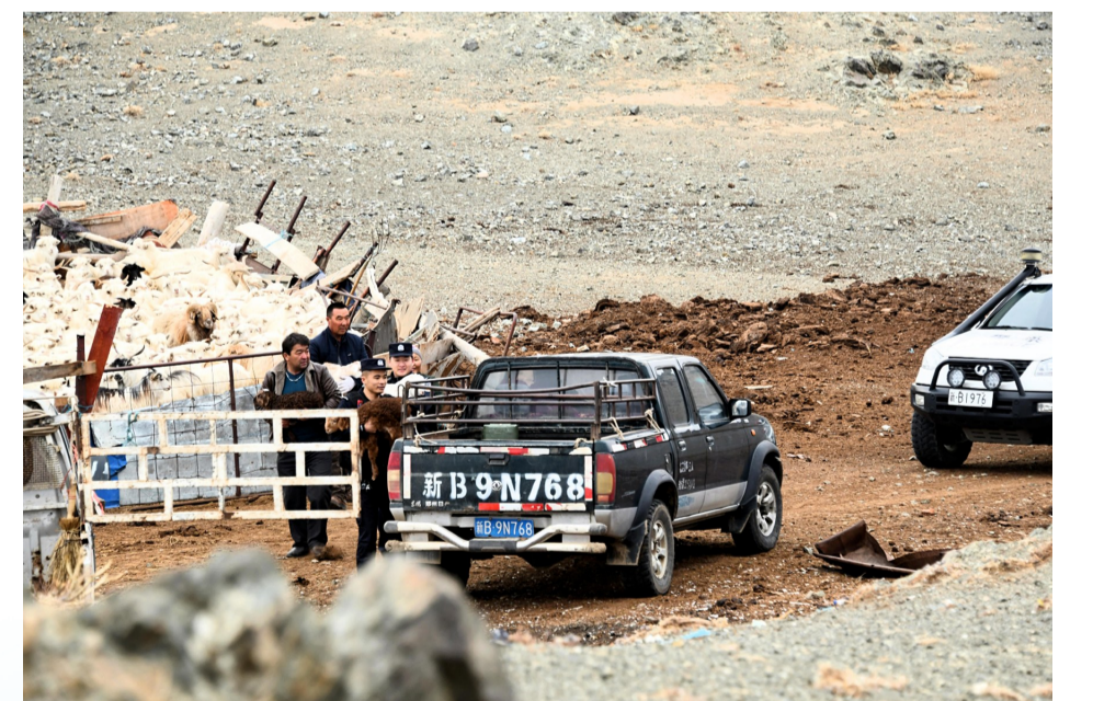
护牧转场服务队民警帮助牧民把出生不久的小羊羔转移到车上。