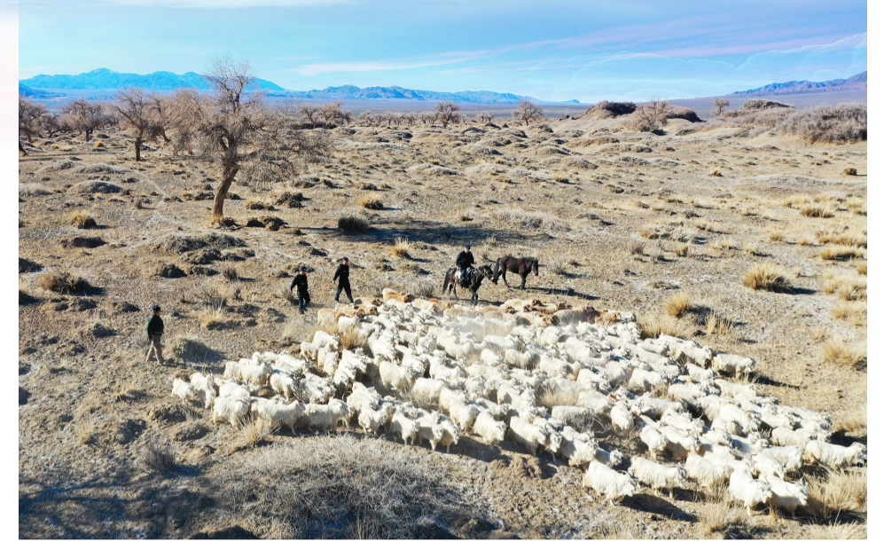
大黄水泉边境派出所民警护航牧民及牲畜春季转场。

党旗高高飘扬在戍边一线。大黄水泉边境派出所前有牧民接力护边,后有群众自发参与志愿服务,他们在苍茫戈壁上共同谱写了一曲忠诚奉献之歌。