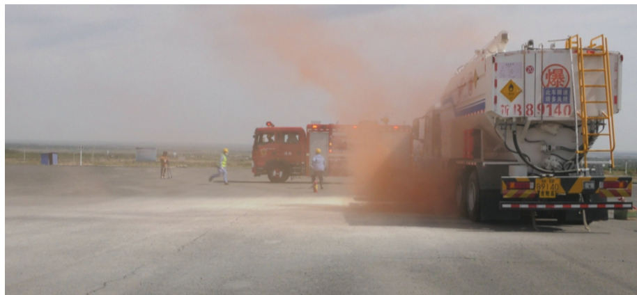
演练模拟在运输过程的混装车被后车追尾发生交通事故后,致硝酸铵泄漏并引起箱体起火的场景,并启动应急预案。

了民爆企业的安全生产主体责任意识,提升了企业应对突发事件的指挥协调和应急处置能力,增强了企业员工的消防安全意识和自救能力。