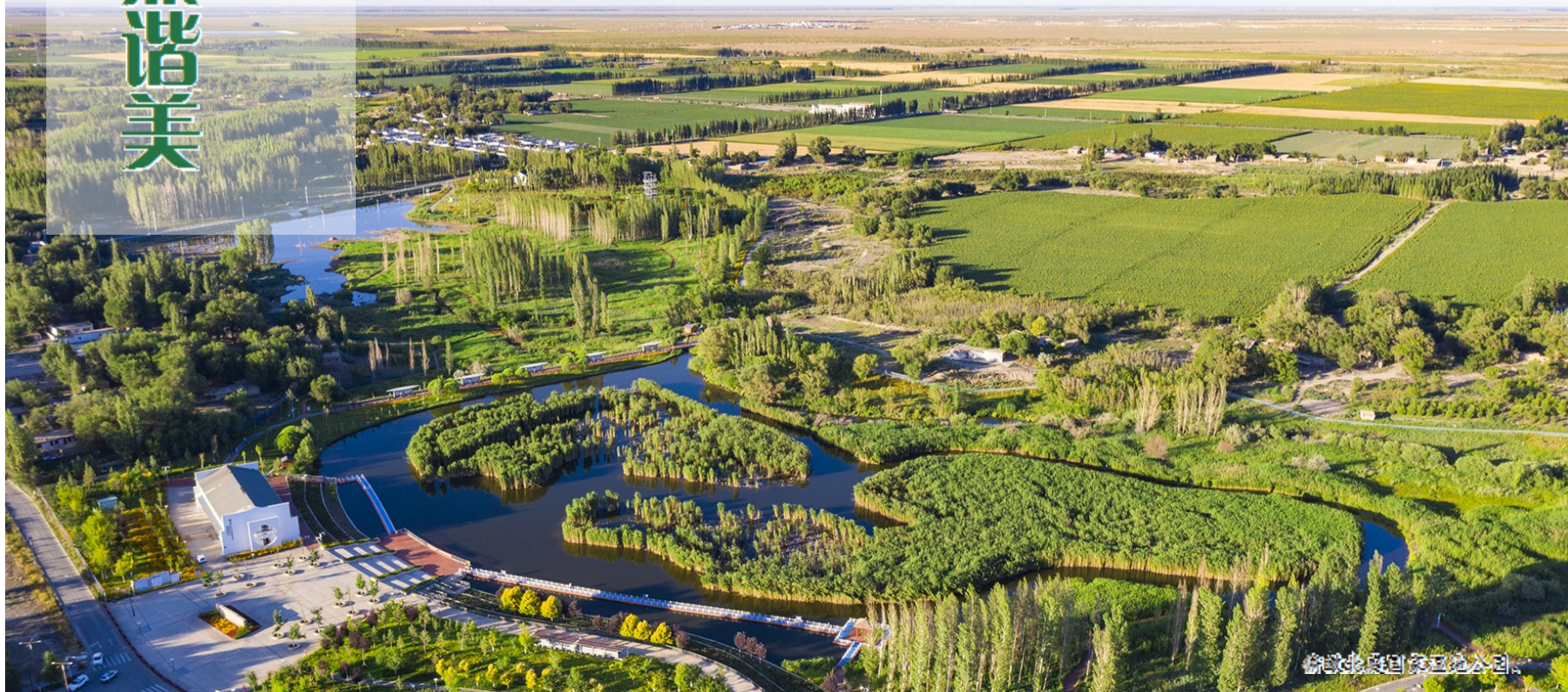
俯瞰北庭国家湿地公园。

晚上9时,云翳与霞光交相辉映,醉人的草色与山光铺陈在眼前,仿佛一幅巨型山水画卷,在这一刻,任思绪随风飞扬。游客和附近的居民纷纷来到北庭国家湿地公园,跳舞、游玩、自拍,欣赏着这里的夕照风景。夜色浓妆,丰富多彩的夜生活才刚刚拉开帷幕。