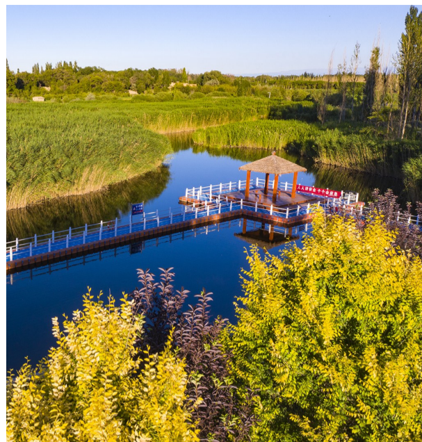
北庭国家湿地公园一角。