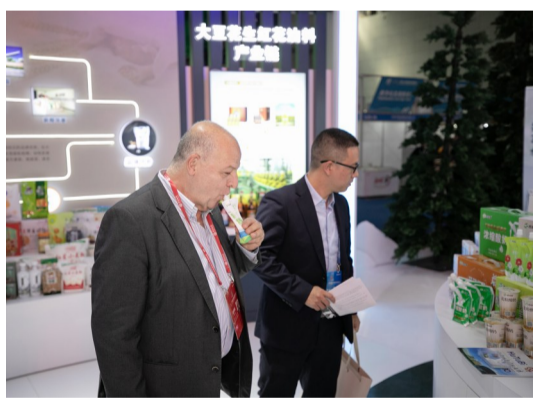
8月17日,嘉宾在亚欧商博会昌吉州展区品尝西域春酸奶。