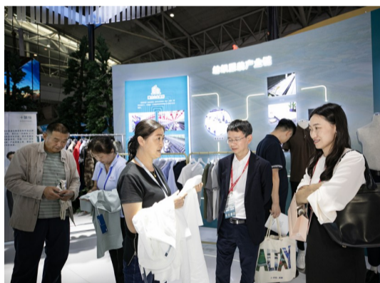
8月17日,嘉宾在亚欧商博会昌吉州展区咨询高品质衬衣。