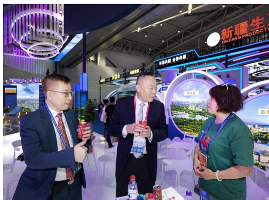
8月17日,嘉宾在亚欧商博会昌吉州展区了解笑厨番茄汁。

秋高气爽,丰收在望。天山脚下,以“弘扬丝路精神 深化亚欧合作”为主题的2023(中国)亚欧商品贸易博览会(以下简称:亚欧商博会)于8月17日至21日在新疆国际会展中心举办。参加展会的境内外企业有1300余家,其中25家世界500强企业、7家中国500强企业、117家行业龙头企业,为历届最多。