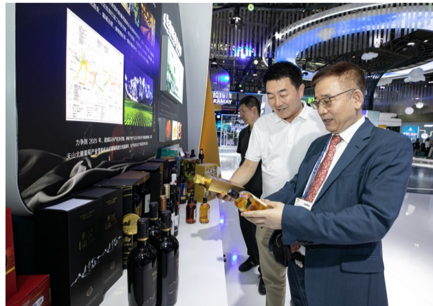
上图:8月17日,嘉宾在亚欧商博会昌吉州展区了解特色红酒。