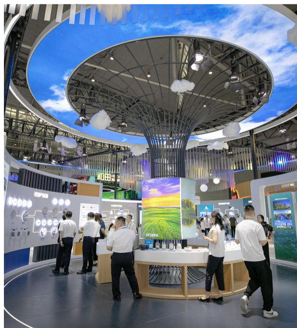
8月17日,客商、嘉宾在亚欧商博会昌吉州展区参观。

在此次亚欧商博会上,昌吉州共签约产业链项目17个,总投资达1026亿元。其中,中车山东风电奇台县智慧能源装备产业示范基地项目,华电、东方电气木垒100万千瓦二氧化碳压缩空气储能综合能源示范项目等7个项目集中签约。