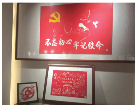
右图:剪纸馆中展出的剪纸作品。

同年7月10日,吕家庄剪纸馆开工建设,8月底竣工,吕家庄村打造剪纸村的事迹也被媒体争相报道。在乡村振兴政策的扶持下,吕家庄村成立了剪纸公司,村民的剪纸被包装成文化产品售卖,增加了村民的家庭收入。