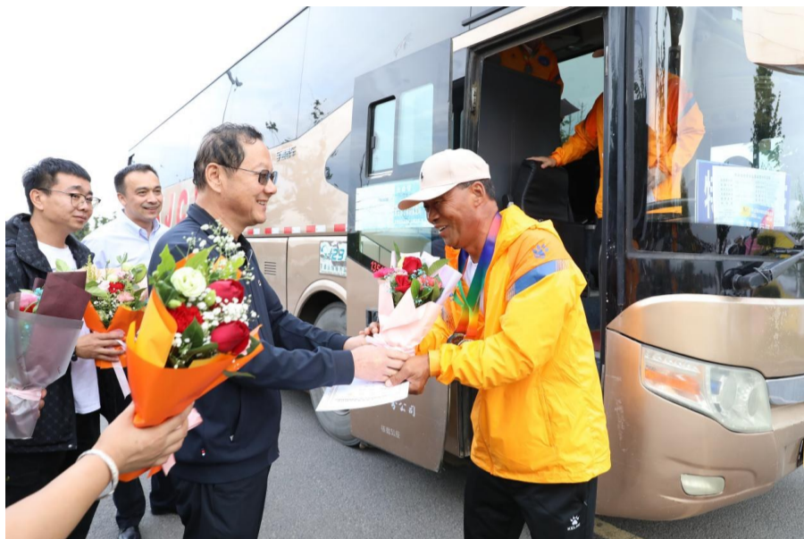
昌吉州残联负责人欢迎载誉归来的残疾人运动员并为他们送上鲜花。

为做好此次残疾人运动会准备工作,进一步提高运动员竞技水平,州残联从昌吉州特殊教育学校聘请4位教练员,同运动员一起进行为期20天的全封闭式训练。同时,州残联协调6名残联工作人员全程陪同运动员训练,全力做好安全防范工作及食宿等后勤保障工作,并积极与教练员沟通,为运动员量身定制科学系统的训练方案。