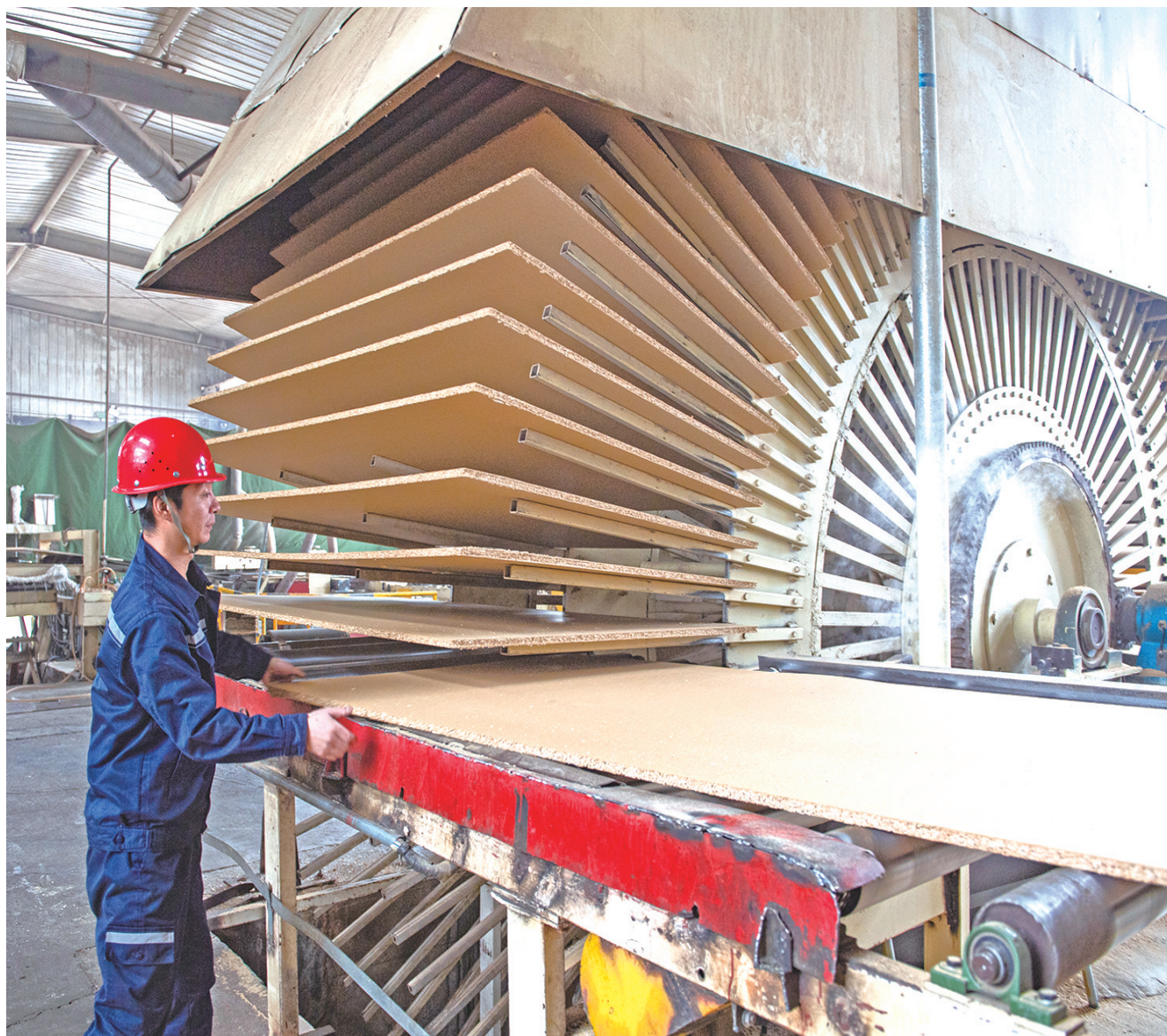
2023年12月24日,位于昌吉国家高新技术产业开发区的昌吉州锐通木业有限公司生产车间,工作人员在刨花板生产线上作业。2023年,该公司获评自治区专精特新中小企业,年产值首次突破亿元。近年来,昌吉国家高新技术产业开发区持续推动专精特新企业培育,促进中小企业发展,目前,园区内共有自治区专精特新中小企业34家。

昌吉高新区党工委重点针对非公企业党建、要素保障、金融支持、用工难题、科技创新、行政审批、产品供需、企业盘活、政策兑现及其他热点难点问题,每月安排一名班子成员牵头开展“园区说事”活动,全力为企业办实事、解难题,持续优化营商环境。